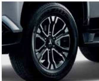
ล้อแม็กสปอร์ตดี (ราคาต่อ 1 ล้อ) Alloy Wheel