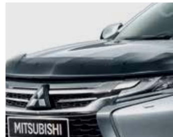
กันแมลงฝากระโปรงหน้า Hood Protector