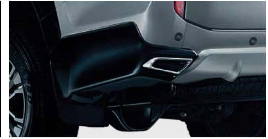
ชุดชายกันชนหลัง (มีสีดำและสีเทาดำ) Rear Corner Protector