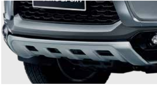
ชุดตกแต่งใต้กันชนหน้า Front Under Garnish