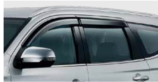
คิ้วกันสาดข้าง Side Window Deflector