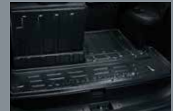
ถาดใส่ของท้ายรถ Luggage Tray