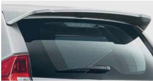
สปอยเลอร์หลัง (มีสีตามสีตัวถังรถ) Tailgate Spoiler