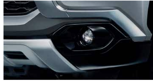
ชุดชายกันชนหน้า (มีสีดำและสีเทาดำ) Front Corner Protector