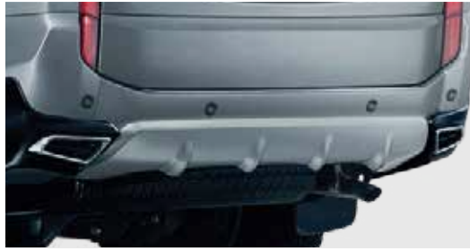
ชุดตกแต่งใต้กันชนหลัง Rear Under Garnish