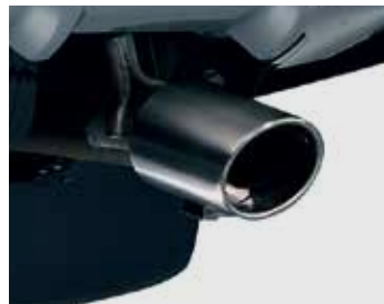
ปลายท่อไอเสีย Exhaust Finisher