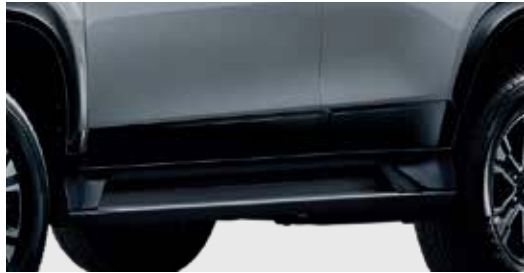
ชุดตกแต่งข้างประตู (มีสีดำและสีเทาดำ)* Side Garnish