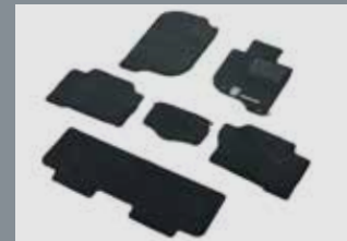
พรมปูพื้น Textile Floor Mats