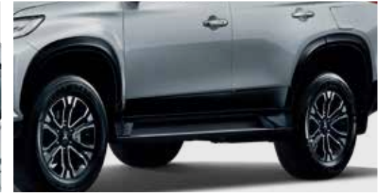
ชุดซุ้มล้อบังโคลน (มีสีดำและสีเทาดำ) Fender Arch Molding